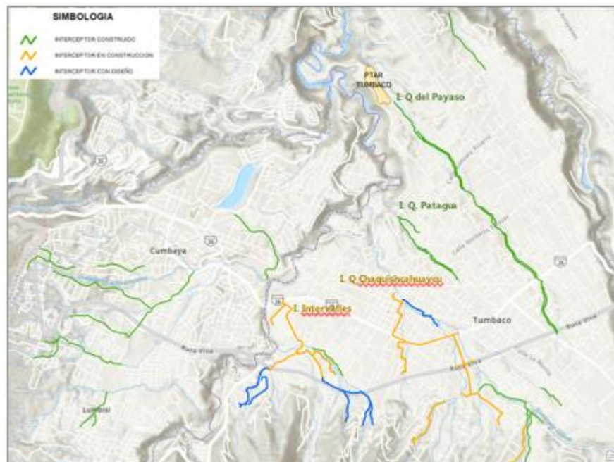
Gráfico 2: UBICACIÓN PROPUESTA DE LA PTAR CUMBAYÁ – TUMBACO

El PDRQ se enmarca en la Directriz 2 “Gestión del territorio para la transición ecológica” de la Estrategia Territorial Nacional, del Plan de Creación de Oportunidades 2021-2025 de la República del Ecuador. Esta directriz tiene cuatro lineamientos territoriales: 1. Educación para el cambio de estilos de vida, 2. Actividad económica sostenible, 3. Acciones para mitigar al ambiente, 4. Gobernanza para la sostenibilidad. Dentro del tercer lineamiento, en el que enmarca el presente proyecto, el Estado busca "Implementar esquemas para la gestión integral de pasivos ambientales, desechos sólidos, descargas líquidas y emisiones atmosféricas contaminantes, así como de desechos tóxicos y peligrosos, considerando tanto las zonas urbanas y rurales".